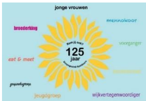
125 jaar DGA-logo

Eindelijk kwam het er dus toch van, aandacht voor het feit dat onze Doopsgezinde gemeente Apeldoorn 1 mei jl. 125 jaar bestond. Door de Coronaperikelen moest de viering een paar keer uitgesteld worden, tot het op 31 oktober 2021 mogelijk werd een groter aantal personen te ontvangen. Voordeel: het gaf de voorbereidingsscommissie wel wat meer tijd een plan te bedenken. En uit te voeren.