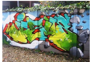
Impressie Bijbelse graffiti-muurschilderingen