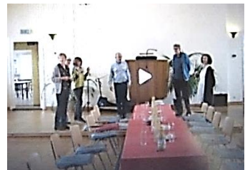
Tafel gereed voor een hapje en drankje 's avonds

In de kerkzaal waren met de rijdende panelen en kleurige doeken slaapplekken ingericht. Ook in de kerkenraadskamer, in de Mennozaal en boven sliepen pelgrims. Dat waren Zweden. Dankzij Google Translate konden de mededelingen voor de pelgrims in het Zweeds worden vertaald. Aan het einde van de dag heerste er een vredige sfeer in de Vermaning.