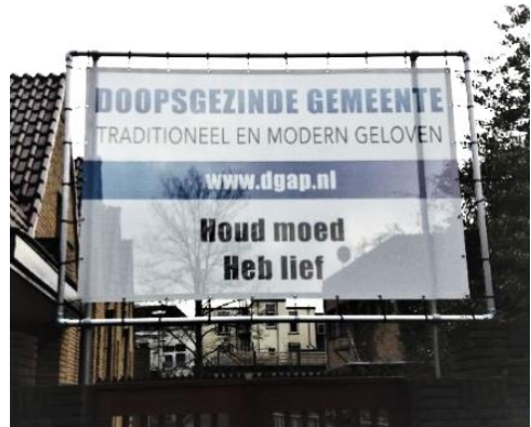
Het nieuwe raamwerk bij de kerk