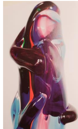
Annemiek Punt, glaskunst

Mijn hoofd soms onrustig van beelden totdat ze samenvloeien in een beeld van vrede in een beeld dat me omhoogtrekt alles komt in het licht van de liefde.